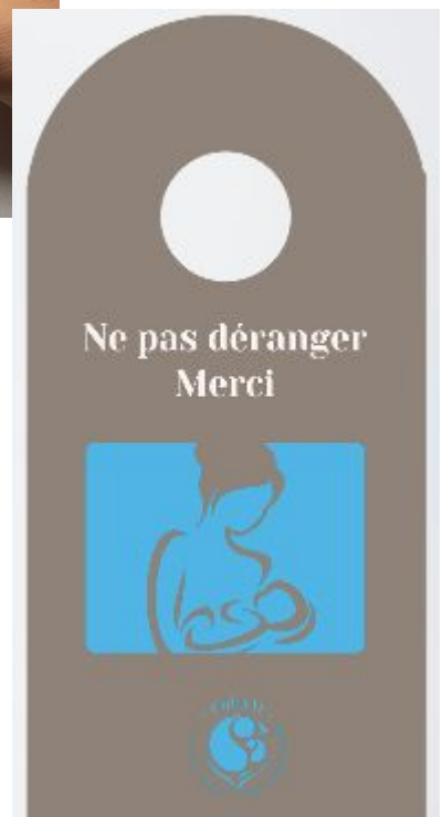
L'accroche porte (Réédition 2017)